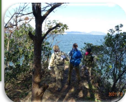
四国本土最北端からの眺め