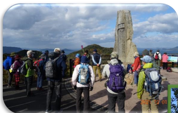
あじ竜王山公園にて休憩