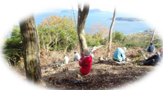
西鎌尾根のブランコで♪