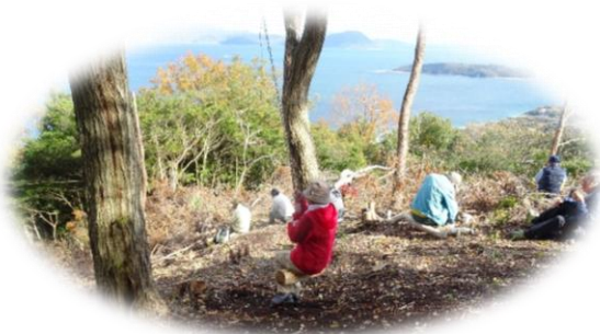
西鎌尾根のブランコで♪