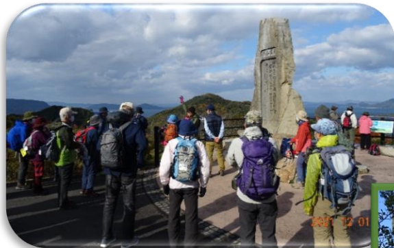
あじ竜王山公園にて休憩