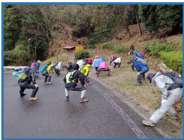
雨の中、入念に準備体操をします

雨の中での里山歩きでしたが、全員リタイアすることなく、怪我もなく無事に帰ってこれました。