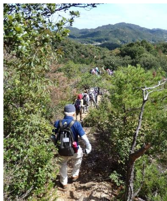
みろくアルプスの尾根を歩く