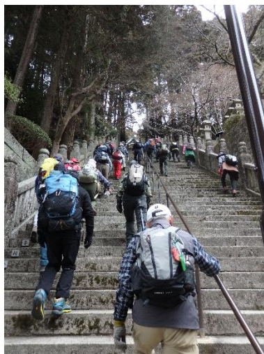
般若心経を唱えつつ...