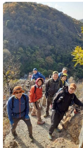
健脚者コース 我拝師山から