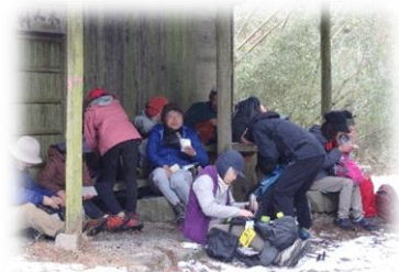
二軒茶屋で昼ごはん