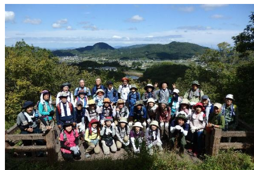
三石山展望所にて