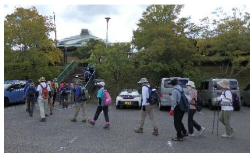
みろく自然公園を出発