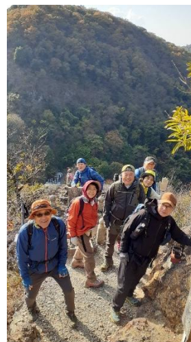
健脚者コース 我拝師山から