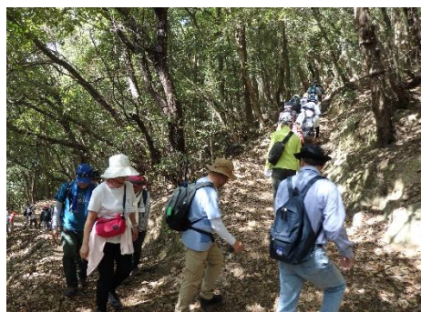
木漏れ日の中 紫雲山に登る