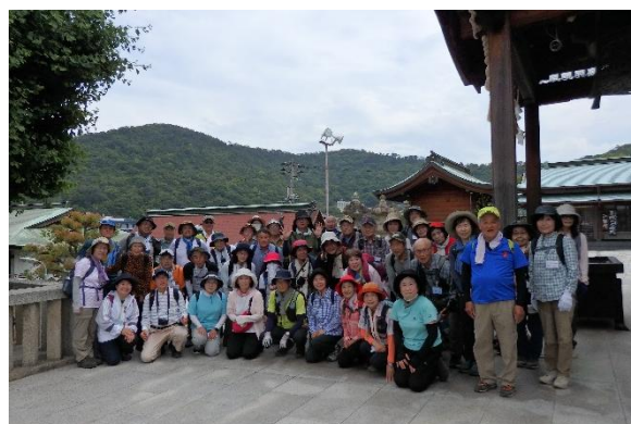
紫雲山をバックに石清尾八幡神社ではいチーズ 📷