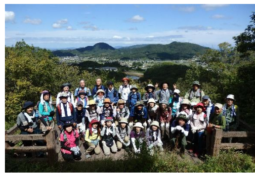
三石山展望所にて