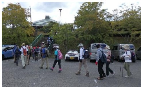
みろく自然公園を出発