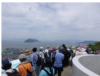
石清尾山展望台から瀬戸内海を望む