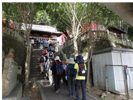
中野稲荷神社からスタート