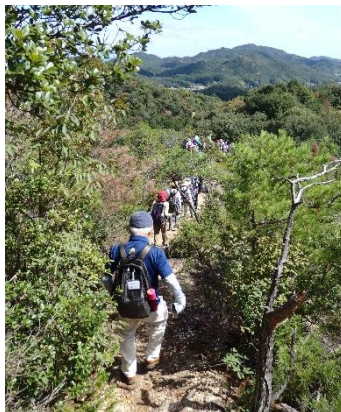
みろくアルプスの尾根を歩く