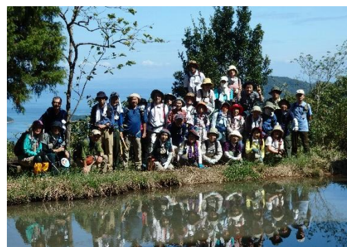
火山山上瓶盥にて