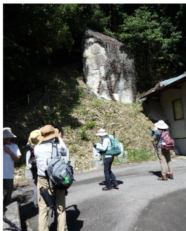
西教寺奥の院の磨崖仏