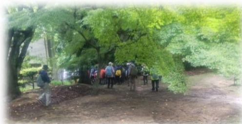
峰山公園キャンプ場から下山開始