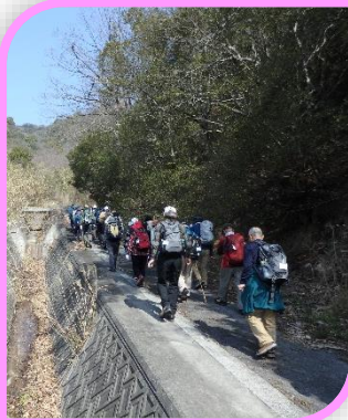
大浜登山口から出発