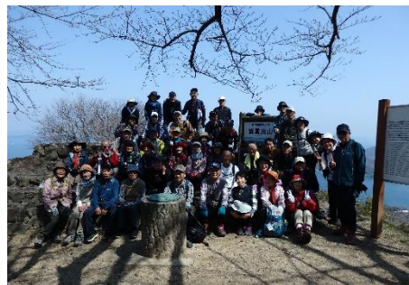
山頂駐車場展望所にて