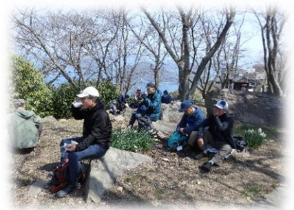
紫雲出山山頂で昼食🍱