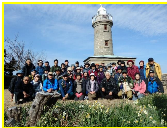
男木島灯台とスイセン