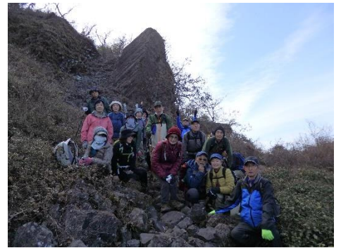
タンク岩 (玄武岩の柱状節理)