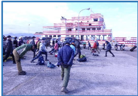
男木港で準備体操