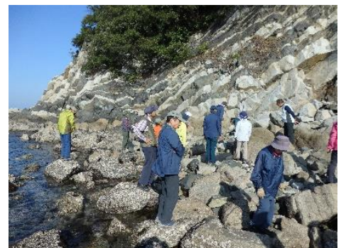
鹿浦越のランプロファイヤ岩脈 白と黒の縞模様が美しい!