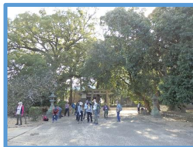
無事に下山(白鳥神社御旅所)