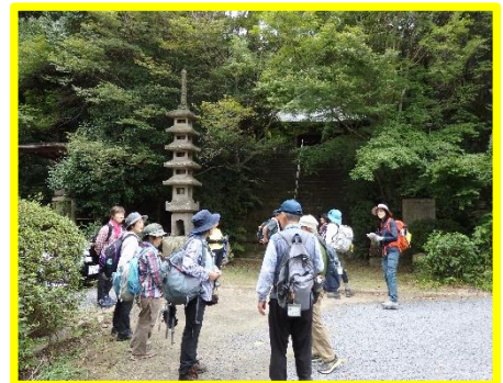
無事に鷲峰寺へ下山