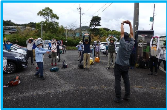
出発前の準備体操