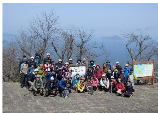
瀬戸内海がきれいです