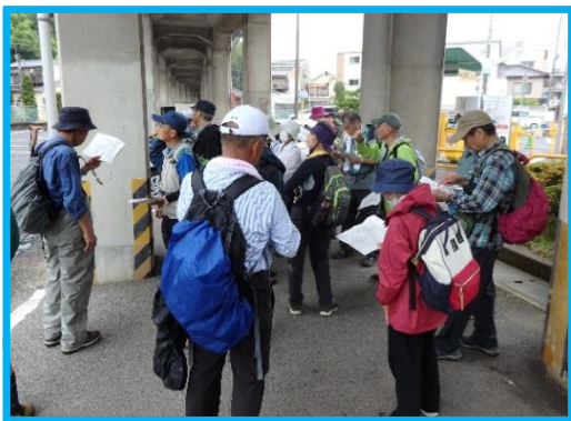
雨天のため JR 高架下で受付、出発式